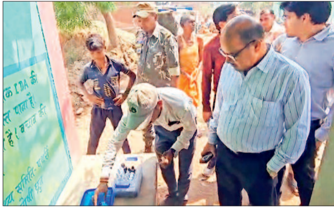
हरिभूमि न्यूज | राजिम/गरियाबंद